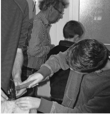
Beim Nistkasten basteln.